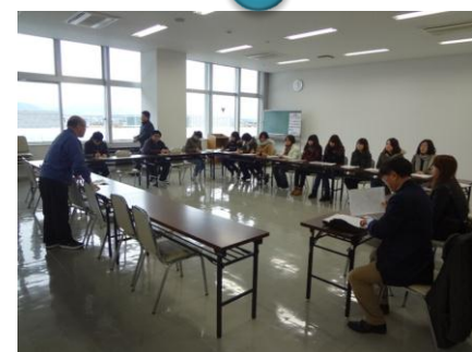
青果卸売業者に企業訪問