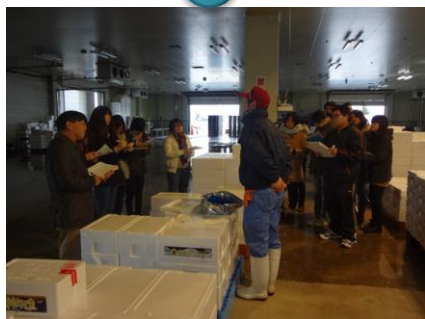
早朝のせり場の様子を再現