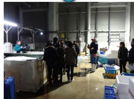
槽で泳いでいる魚にビックリ！