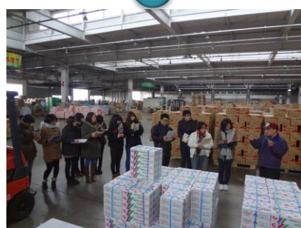
高く積まれた商品は大迫力