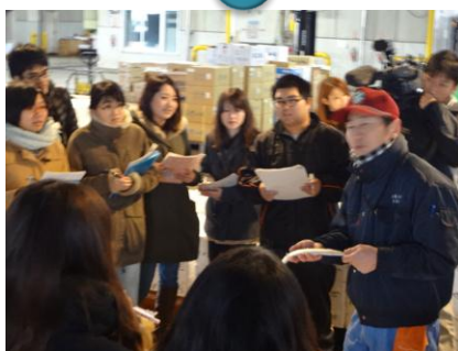
魚の説明は興味深いものばかり