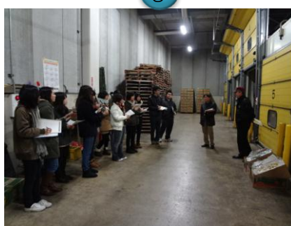
バナナ室で果実輸入の貴重なお話